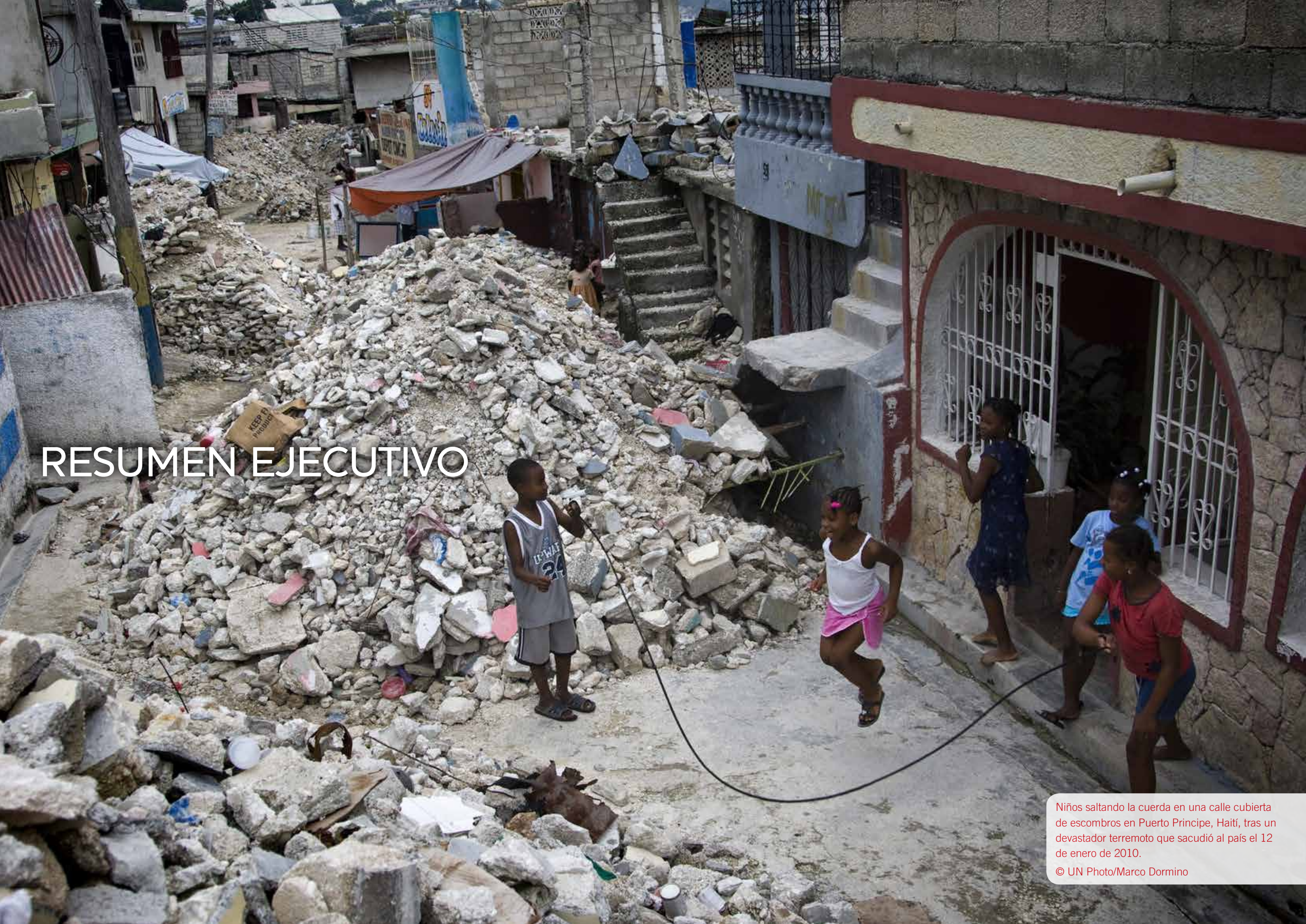
Niños saltando la cuerda en una calle cubierta de escombros en Puerto Príncipe, Haití, tras un devastador terremoto que sacudió al país el 12 de enero de 2010.